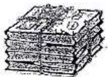
新聞紙（折込広告を含む）